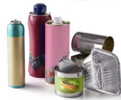
Les boîtes métalliques, aérosols (acier, aluminium)