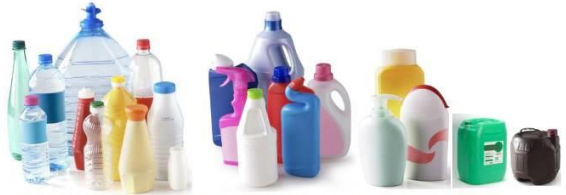
Les bouteilles, bidons, flacons en plastiques (alimentaire, entretien, hygiène)