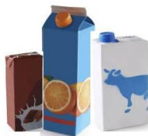
Les briques alimentaires